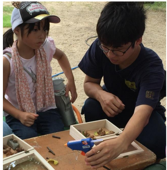
ホットボンドの使い方も説明しながら、 やさしく見守るボランティアの大学生。