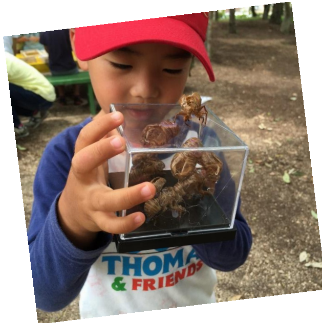
「こんなの 作ったよ！」