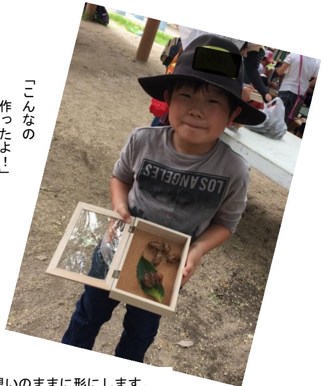
子どもたちの発想は、型にとらわれず、想いのままに形にします。 「見て見て。大きなセミがおんぶしてるんだよ。」 大きなセミの抜け殻の上に、小さいセミの抜け殻がのっかっている。 おんぶは気持ちよかったんだね、きっと。 葉っぱの上は気持ちいいし、友だちといっしょに居るっていいね。