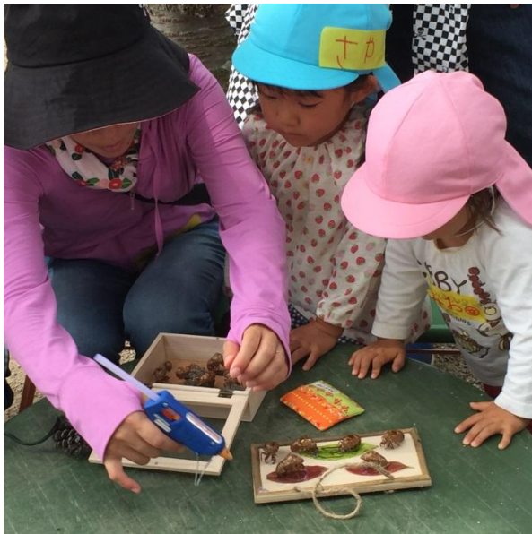
オブジェ作り 子どもたちのリクエストに応じ、並べていく。 子どもも真剣、お母さんも真剣。