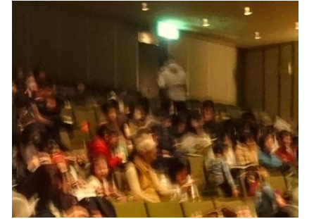
会場がいっぱいになったね!

★ふうせんのときに、ちいさいふうせんにはいっていたから、だいじょうぶかなとおもいました。(1年女子) ★みなさんへ。おもしろかったです。ひなもそんなことができたらいいのにな。みなさんだいすきです。(1年女子) ★ちゃんさんがおもしろかった。げんきぼおずがおもしろかったり、いろいろなところがたのしかったよ!!(1年女子)