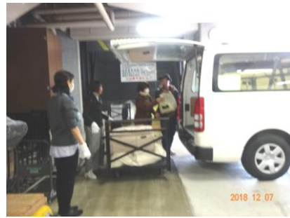
荷物が続々と出てきたよ!