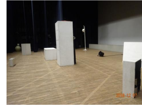
開演を待つ、白い箱、箱、箱