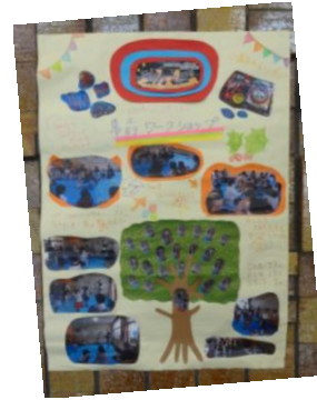
2階のロビーで、事前の様子を見たり、写真を撮ったりしたよ。