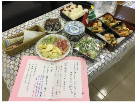
楽屋に、軽食を準備!