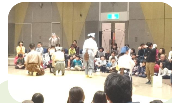
お礼のプレゼントを渡しました。