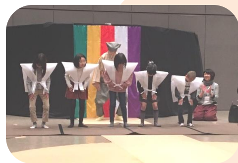
8人の会員が、狂言師に挑戦しました。