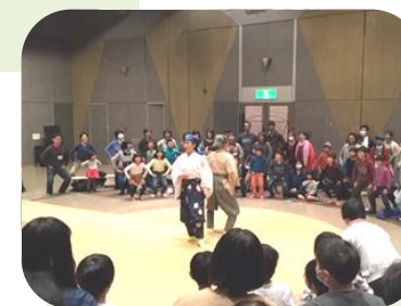
公演後のワークショップもたのしかったね。