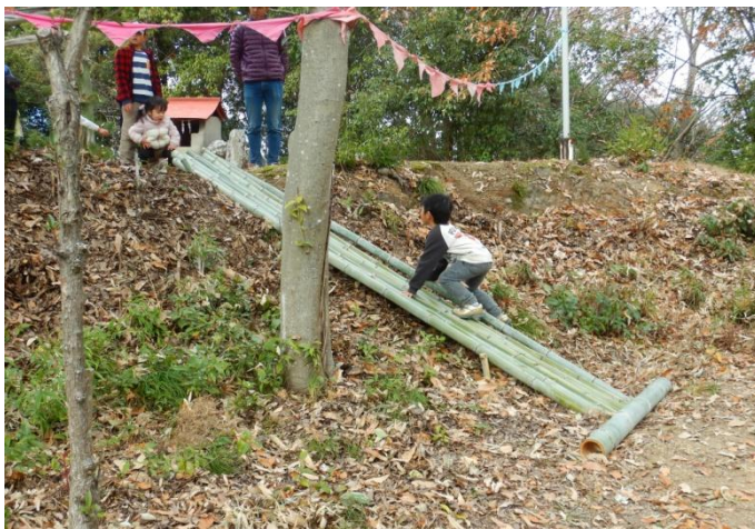
切り出した竹を斜面に並べて、固定。滑ってよし、登ってよし。