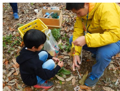
一緒にいるだけで、たのしい。