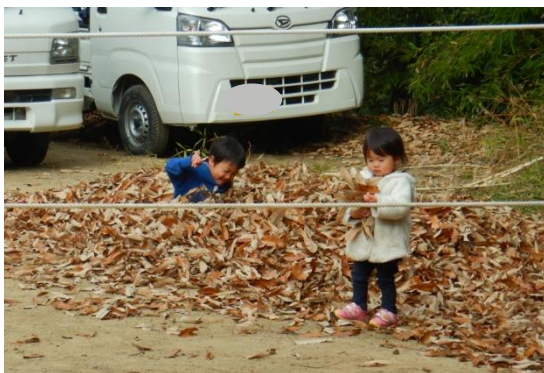
肌で感じる落ち葉。