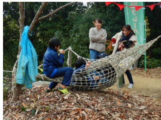
ハンモックの中のぎゅうぎゅうが、楽しいみたい。