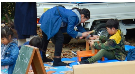
動かないように、しっかり持って、釘を打つ。 力を合わせて。