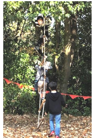
上にいく縄ばしご