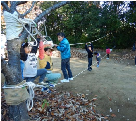
木と木に張ったロープ。2本から1本増やすと…揺れ具合が様々で、ますます。おもしろい。