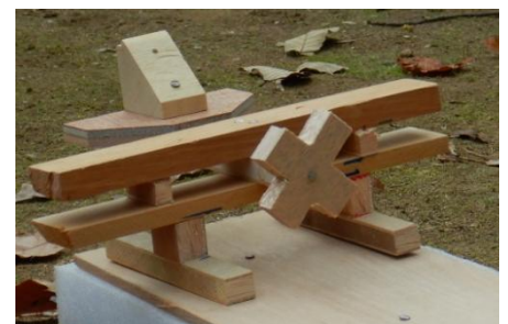
木工での作品。この滑走路から、 今にも飛び立ちそう！